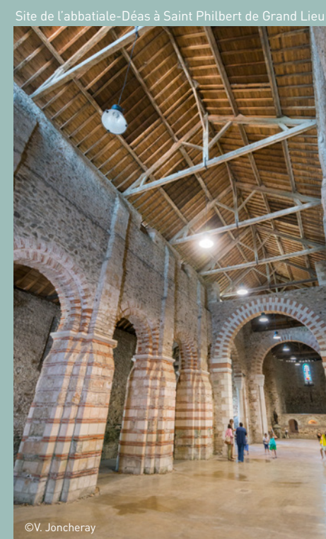
Site de l'abbatiale-Déas à Saint Philbert de Grand Lieu