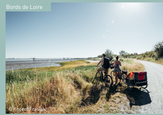
Bords de Loire