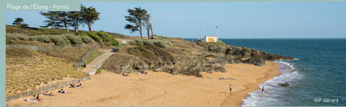
Plage de l'Étang - Pornic