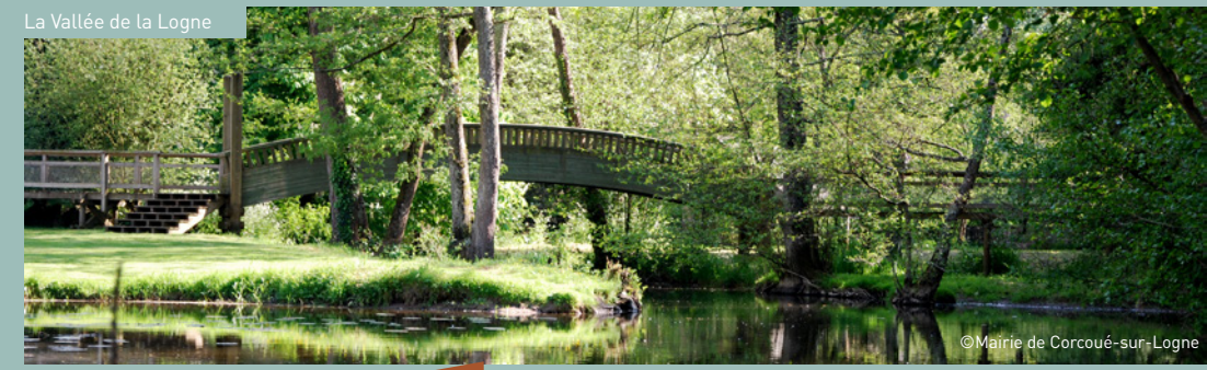
La Vallée de la Logne