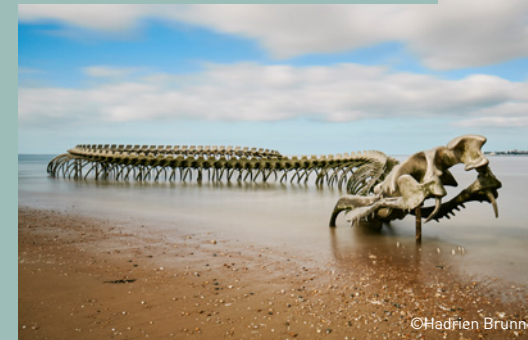
Serpent d'Océan - Œuvre Estuaire - Saint Brevin