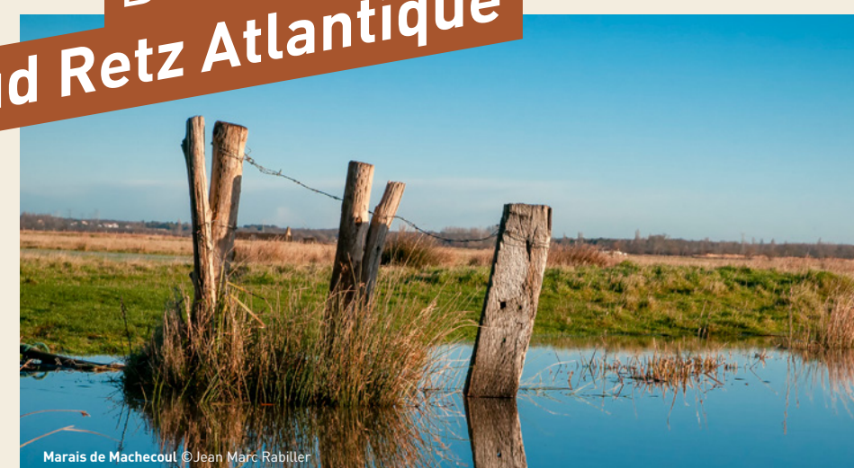
Marais de Machecoul